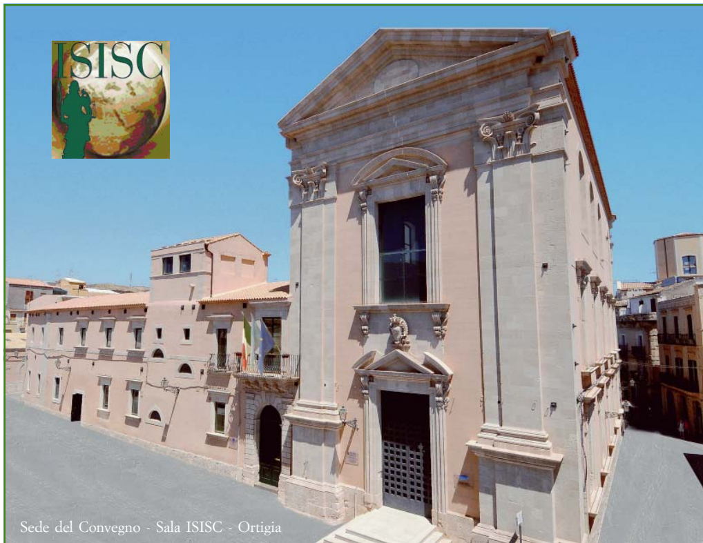
Sede del Convegno - Sala ISISC - Ortigia