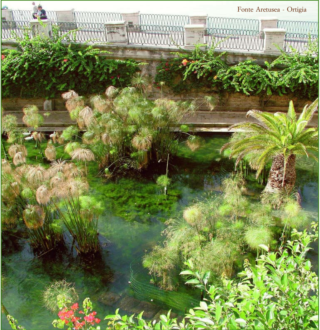
Fonte Aretusea - Ortigia